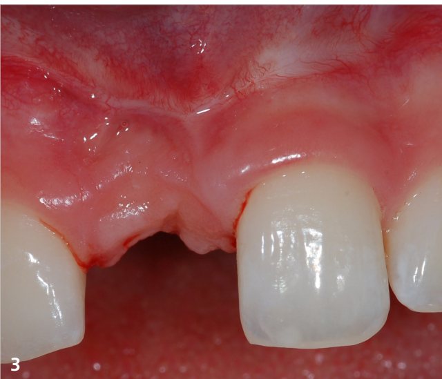
Abgeheilte Situation vor Implantation