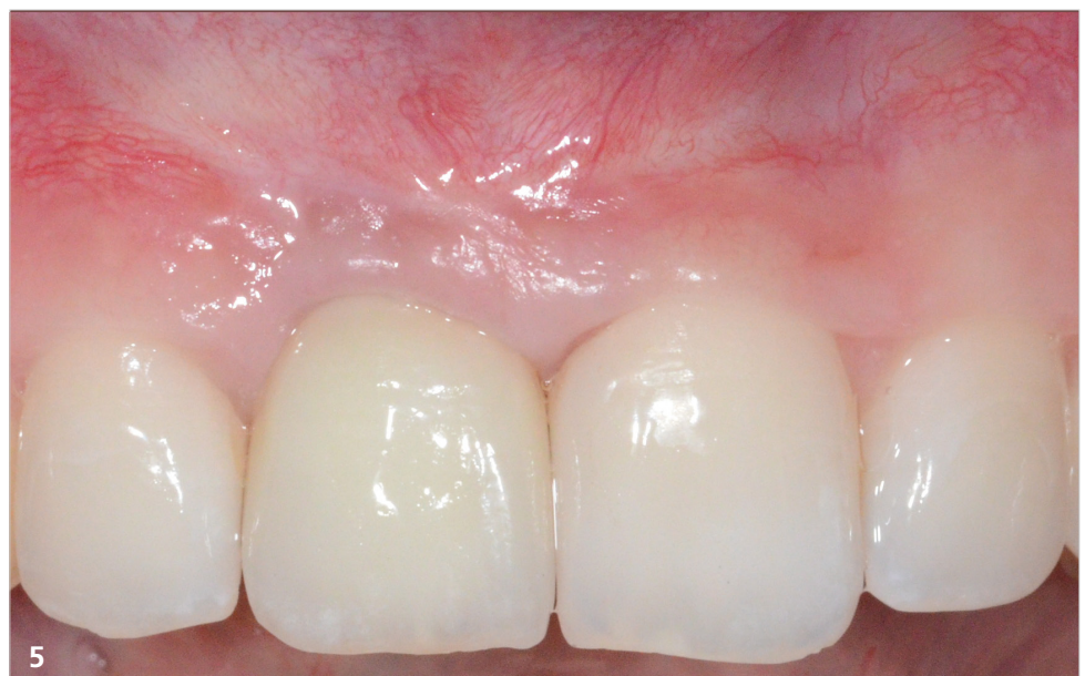
Abschlussbild mit vollkeramisch verschraubter Einzelzahnkrone in Regio 11. Zahntechnische Arbeit von: ZTM Bruno Jahn aus Frechen

— Pfanmüllerstr. 48 60488 Frankfurt Tel.: 069 78 93 08-8 E-Mail: info@dent-docs.com www.dent-docs.com