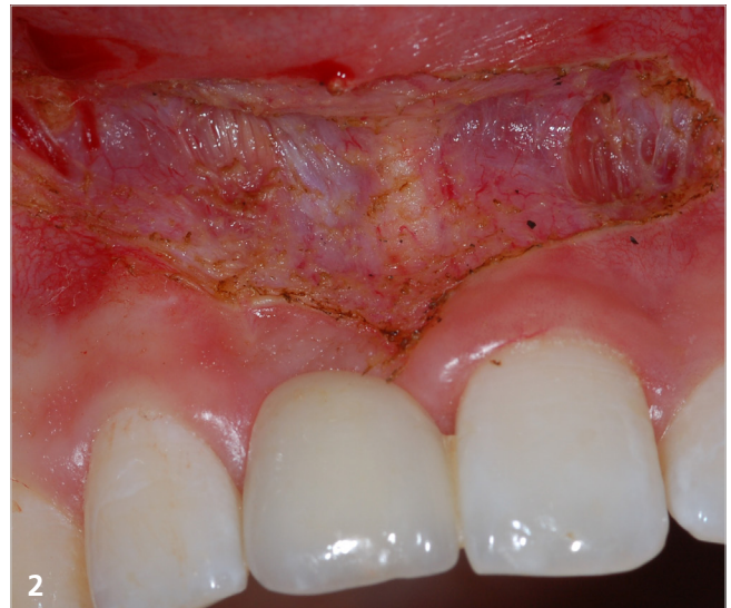
Befund direkt nach der Lasertherapie