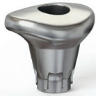
Atlantis Healing Abutment

Hohe ästhetische Ansprüche machen die Ausformung des Weichgewebes im frühen Zeitpunkt des Heilungsprozesses besonders wichtig. Kontrollieren Sie die temporäre Versorgung mit einer patientenindividuellen Lösung auf der Grundlage der Implantatposition.